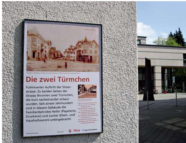
Die Gebädetafel beim Dorfplatz 4