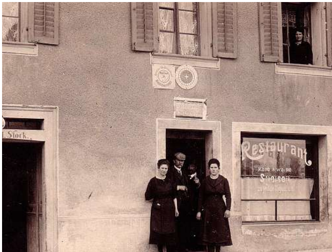
Wirtsleute des «Raben»